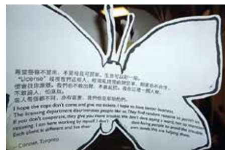
© ALVIS CHOI, BUTTERFLY COMMUNITY ARTIST

Butterfly has developed publications and workshops on the interests of migrant sex workers. Creativity is important for creating space for different forms of participation in lobbying and advocacy. For example, Butterfly developed a "Butterfly Voices Community Art Project" with Alvis Choi, a community artist, to support migrant sex workers in developing their artwork and storytelling. This helped share their experiences and ideas with other sex workers as well as the public. 5 Food, parties and cultural events are also important in the sex workers' rights movement!